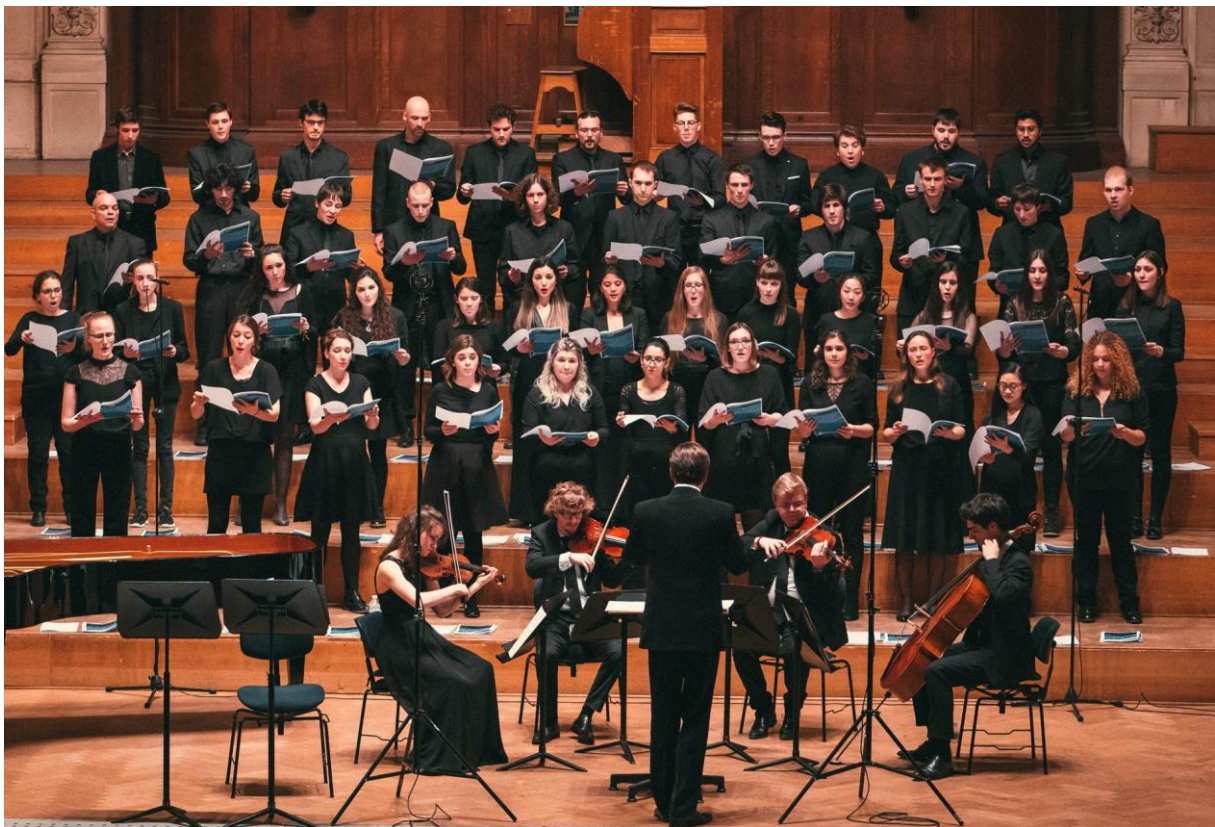
Uitvoering koorwerk van Ola Gjeilo, Ēriks Ešenvalds en John Barry door het KCB-koor & het KCB-strijkkwartet, maart 2018.