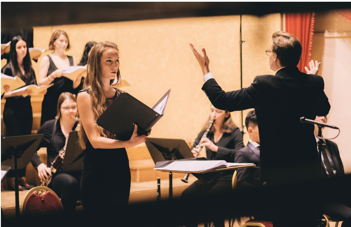
Uitvoering van Dvořáks 'Mis in D-groot' Op. 86 door het KCB-koor & het KCB-houtblazersensemble, maart 2019.