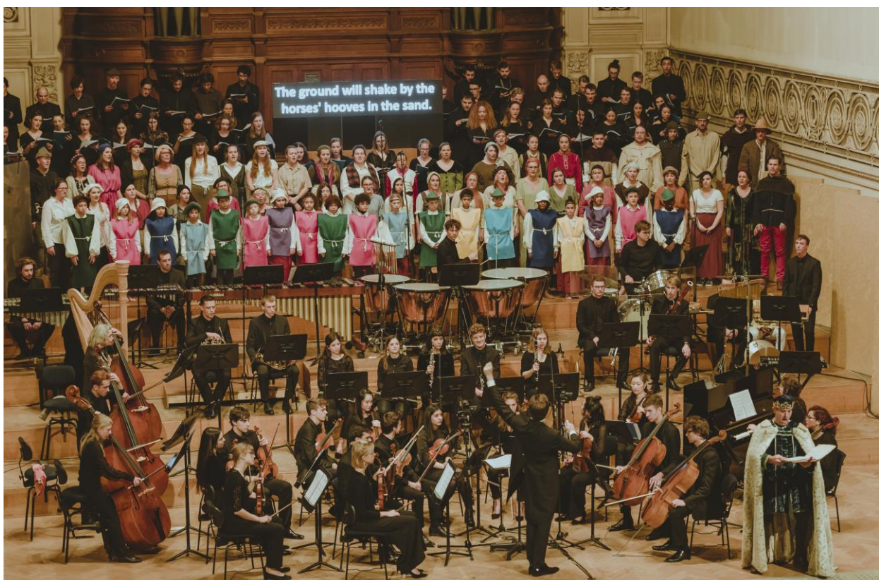
Uitvoering opera 'Leedberg' door het EhB-koor, het KCB-koor & het KCB-orkest, december 2018.