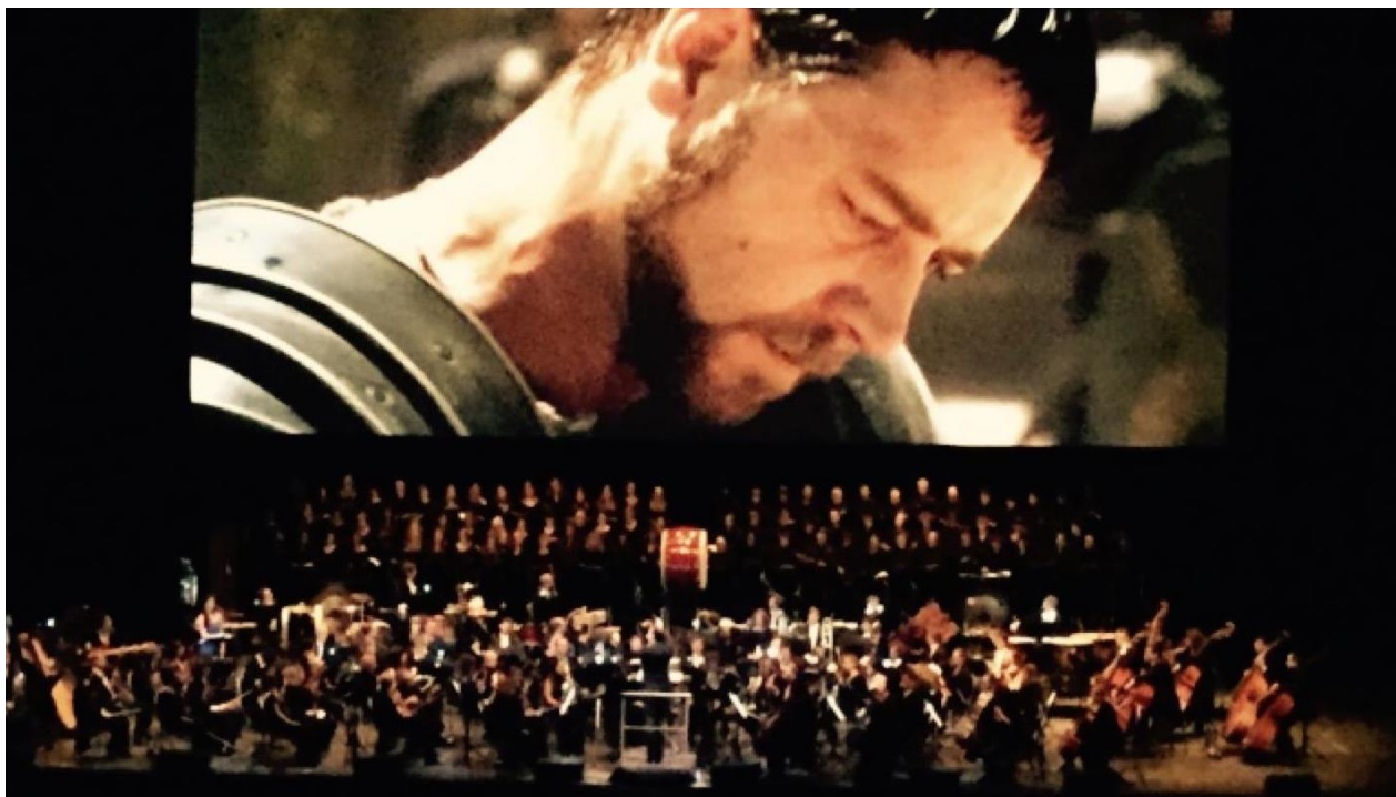
Het KCB-koor zingt de originele muziek van 'Gladiator' 'live to projection' in Brussels Expo, december 2014.

Door de coronacrisis werd in het academiejaar 2020-2021 in kleinere koorgroepen aandacht geschonken aan werk van o.a. Palestrina, Mendelssohn en Kodály. Met het concert van deze avond staat een vreugdevol én volledig KCB-koor opnieuw op het concertpodium!